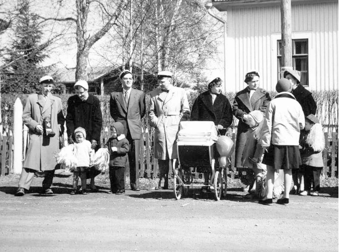
Första maj firas år 1953 i Jalasjärvi i Södra Österbotten.