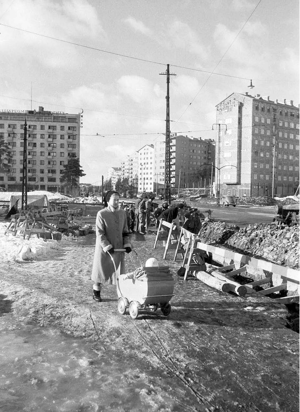
1950-talet var en tid av intensivt byggande av både infrastruktur och bostäder. Här ses en mor på promenad med sitt barn i Helsingfors 1950, i bakgrunden nybyggda våningshus längs Mannerheimvägen.