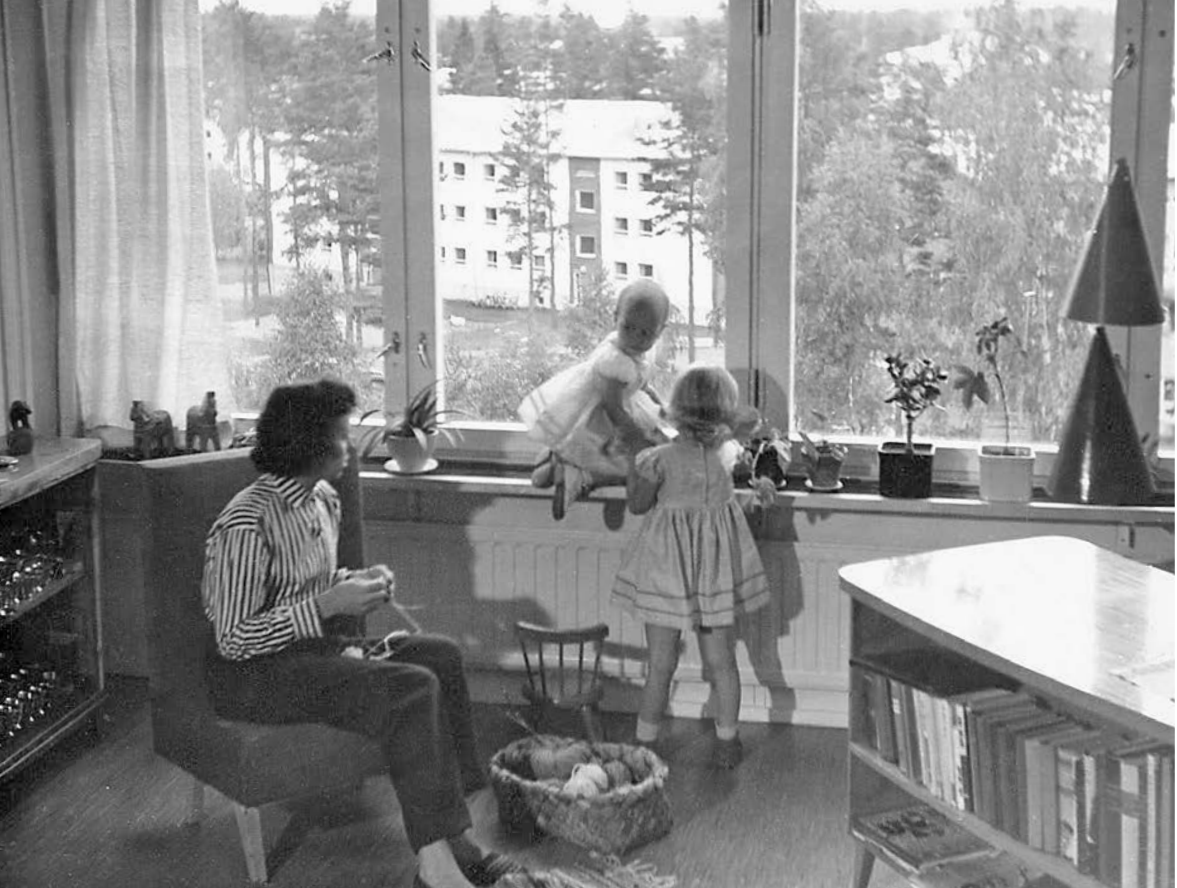
Mor med barn i vardagsrummet i en nybyggd Helsingforsförort. Bilden är från 1957–1959.