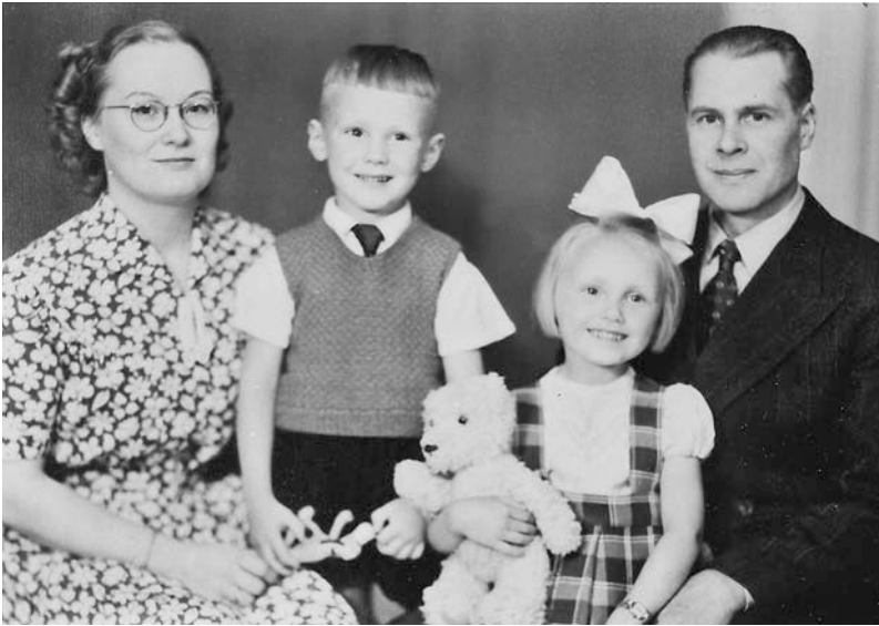
Att bilda familj var något som många kvinnor såg fram emot. Familjeporträtt från 1950-talet.

under 1950-talet, eftersom de som svarat på enkäten var i en sådan ålder att de kunde ha haft en föräktenskaplig graviditet då (Kontula et al. 1994:36). Preventivmedel i form av p-piller kom på marknaden i Finland år 1962 men blev vanliga först på 1970-talet (Pasila 2010:50). Samtidigt som det var relativt vanligt med föräktenskapliga graviditeter innebar de ändå en skam. I en levnadsberättelse berättas om hur äktenskapet ingicks på grund av graviditet, något som enligt skribenten ledde till en del skvaller: