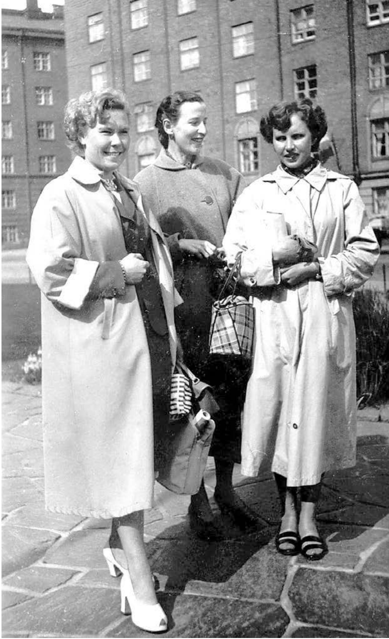
Elever vid bokhandelsskolan Suomen Kirjakauppakoulu i Helsingfors 1954.

tade mitt första barn så sa en äldre gumma att hon är så lycklig över att nutida flickor utbildar sig. [...] Och så sa hon att hon är så lycklig över det att flickor faktiskt numera slutför, får ett slutför, annat än studentbetyg eller skolbetyg. Men man tänkte då ibland, att vi var alla, det var flera familjer och alla fruar var utbildade till någonting och där var vi alla hemma medan mannen var på jobb.