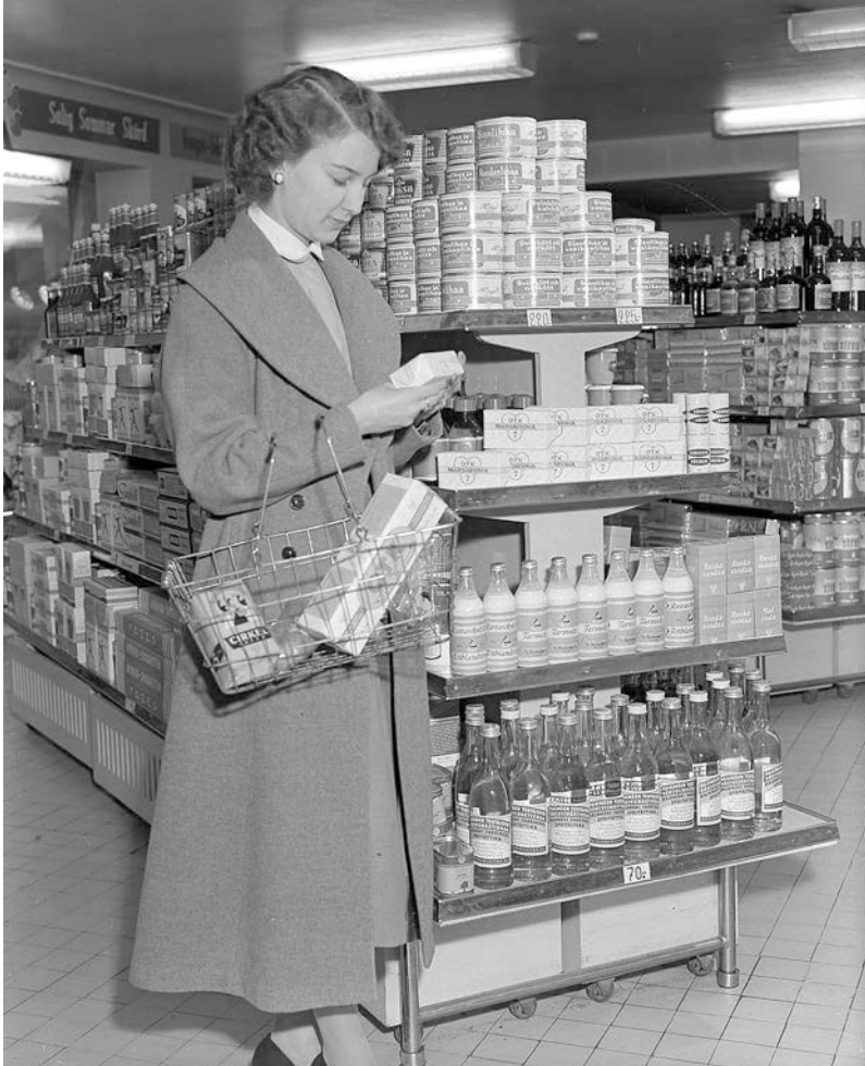
Kvinnorna i denna undersökning anser att det inte fanns färdigförpackad mat på 1950-talet. Snabbköpen och burkmaten introducerades dock vid den här tiden. Kvinnan på bilden handlar mat i ett av Elantos snabbköp i Helsingfors 1955.