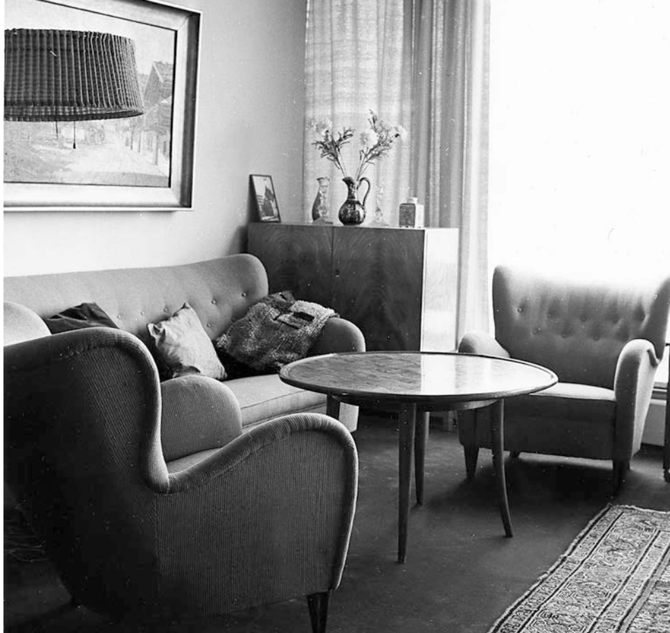
Vardagsrummet var hemmets kärna. Bilden visar hur ett vardagsrum kunde se ut 1957.

för gemenskap och trygghet, samtidigt som dessa rutiner kan uppfattas som tvingande och låsande (Löfgren 2006:15–19). I nutida studier kan hemmet också framställas som en farlig plats, en scen för familjevåld eller specifikt våld mot kvinnor (Niemi 2010:1249). Men hemmet diskuteras också i relation till dess motsats, hemlöshet, som har en stark emotionell laddning. Begreppet hemlängtan sammanlänkas med vemod. Hemmet är mycket mer än en plats där man bor, en bostad, och förknippas ofta med någon form av känsla. Bostaden blir ett hem dels genom att man vistas där en längre tid, dels genom renovering och inredning som bidrar till att ge det en personlig prägel och skapa en hemkänsla (Tuomi-Nikula et al. 2004:9). Hemmets gränser kan sägas vara glidande eftersom hemmet påverkas av den offentliga sfärens regler samtidigt som det är en privat sfär. Det kan vidgas till att innefatta trappuppgången, trädgården, gatan och näromgivningen. Hemmet kan också sägas vara ett nationellt projekt i och med att nya medborgare fostras där (Saarikangas 2004:321).