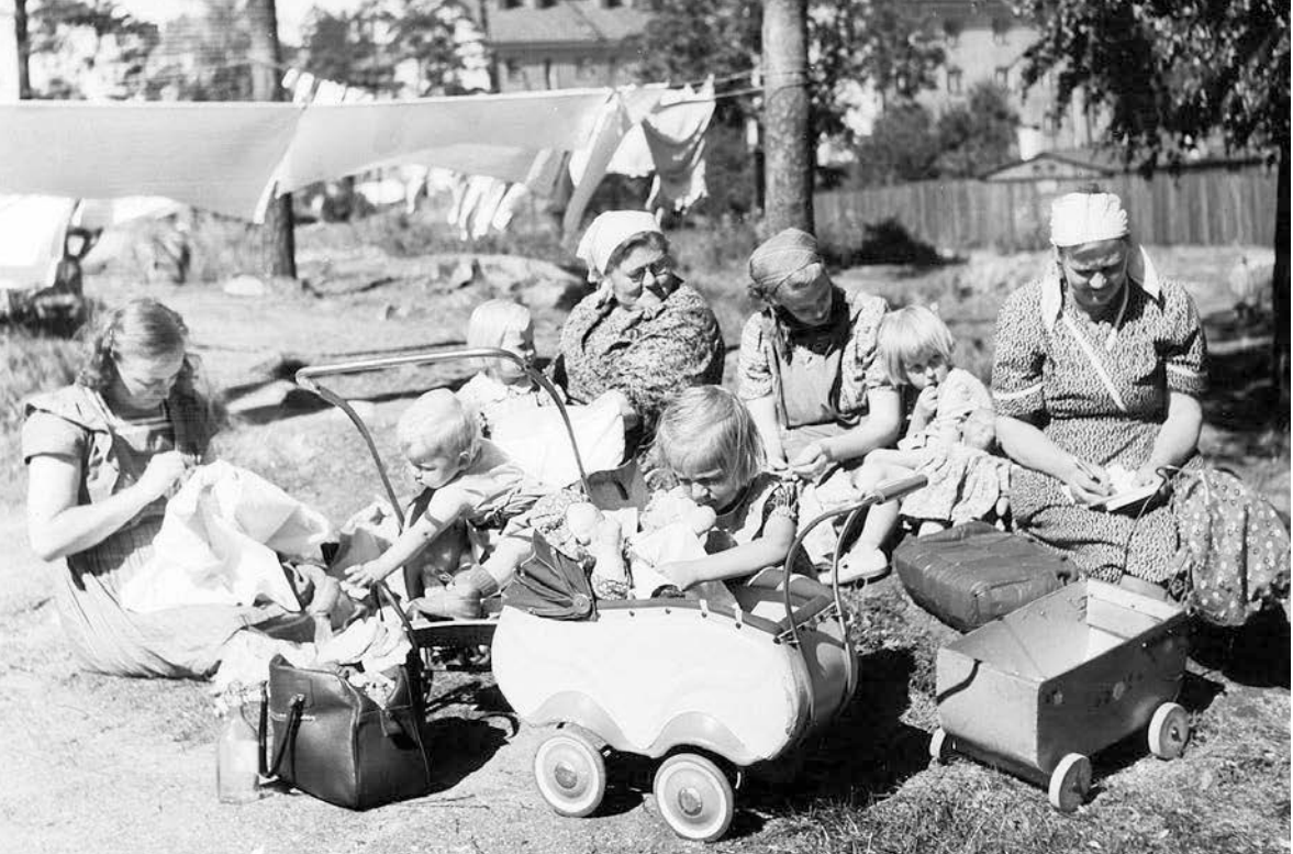
Mödrar och barn i parken i 1950-talets Helsingfors.

väl kaffe åt mig själv och när alla andra hade stuckit i väg så sen började man bädda, städa. Men de kom ju inte hem på lunch utan de åt i skolan. Sen skulle man fara och handla och fundera vad man skulle laga till mat. Byka, stöka och stryka. Att inte hade jag på det sättet problem, satt och funderade att oj vad jag har det besvärligt. Men jag är en sån människa, men alla är inte så här. Det måste man komma ihåg.