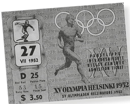
Biljett till de olympiska spelen i Helsingfors sommaren 1952.