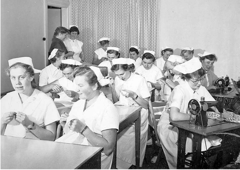
Högvalla seminarium i huslig ekonomi flyttade 1923 till Hindhår i Borgå landskommun. Där fick kvinnor undervisning bland annat i handarbete.