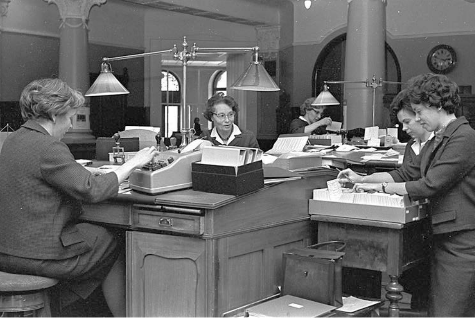
Förvärvsarbete för gifta kvinnor kunde innebära såväl hel- som deltidsarbete. Kontorsarbete på Helsingfors Andelsbank i Österbotten 1966.

Att det [deltidsarbete] mäktar man med. Men heltid och mammor och småbarn är för mycket. Visserligen så nuförtiden delas ju väldigt mycket arbetet mellan parterna. Men i varje fall. [...] Men, men nog är det stressigt. Och jag tror att det är stressigare nu för det begärs så förskräckligt mycket. Folk ska hinna med så mycket.