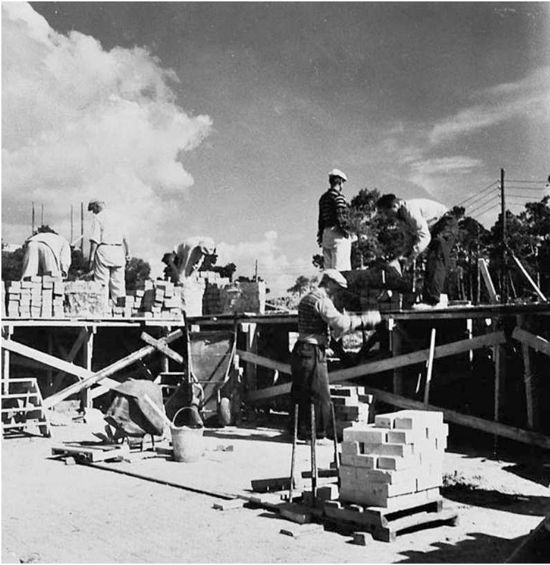
Egnahemshus byggdes efter krigens ofta som talkoarbete, det vill säga så att grannar och vänner hjälpte varandra utan ersättning.

läge används begreppet housewife dock sällan i forskningen eftersom det är kopplat till kön snarare än till de aktiviteter som utförs (Keränen 2004:278).