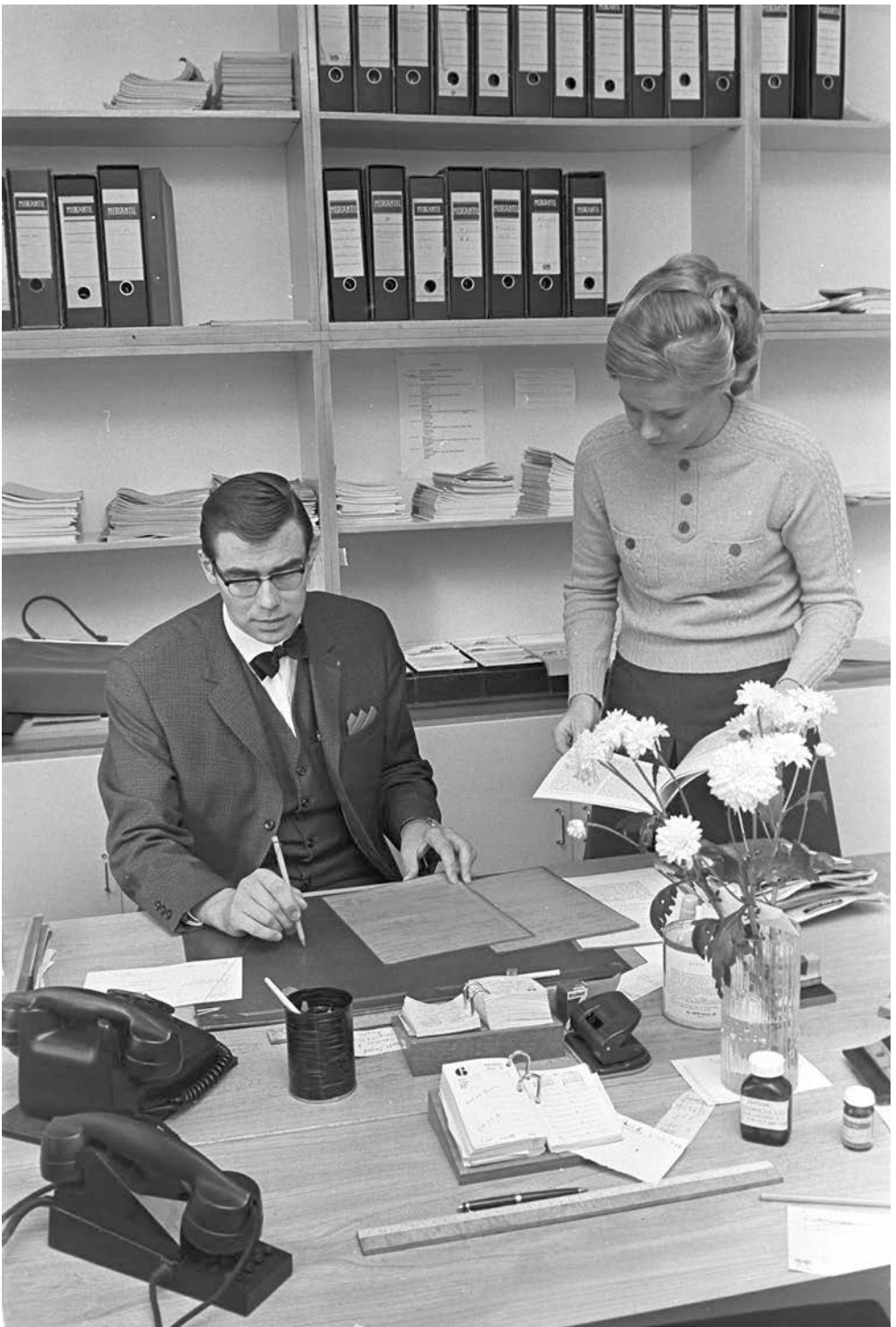
Många kvinnor återgick till arbetslivet när barnen blev större. Ofta handlade det om kontorsarbete, som på denna bild från 1969.