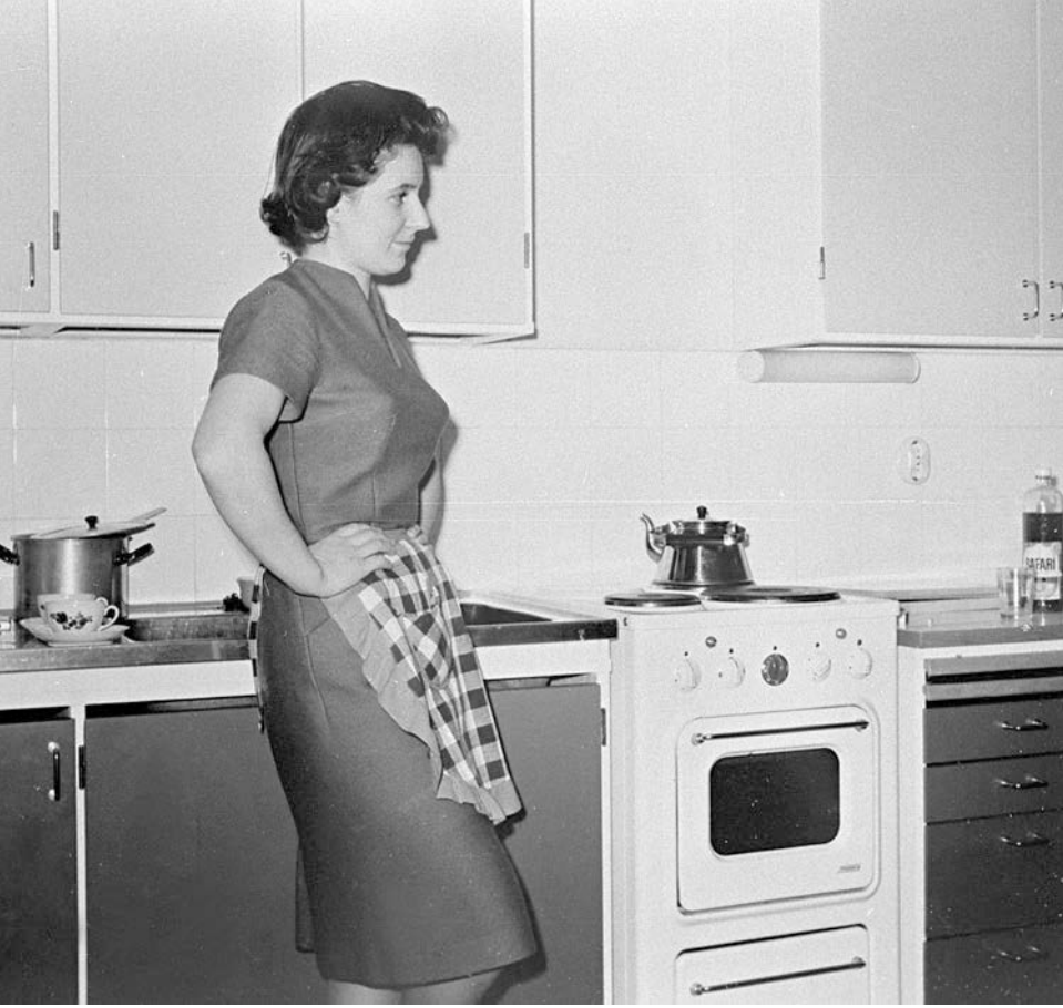
I hemmafruns uppgifter ingick att vara värdinna för gäster i hemmet. Bilden är tagen i Ekenäs 1964.

"Husmorsträffen" där en av deltagarna berättar om sitt sätt att vara en god värdinna: