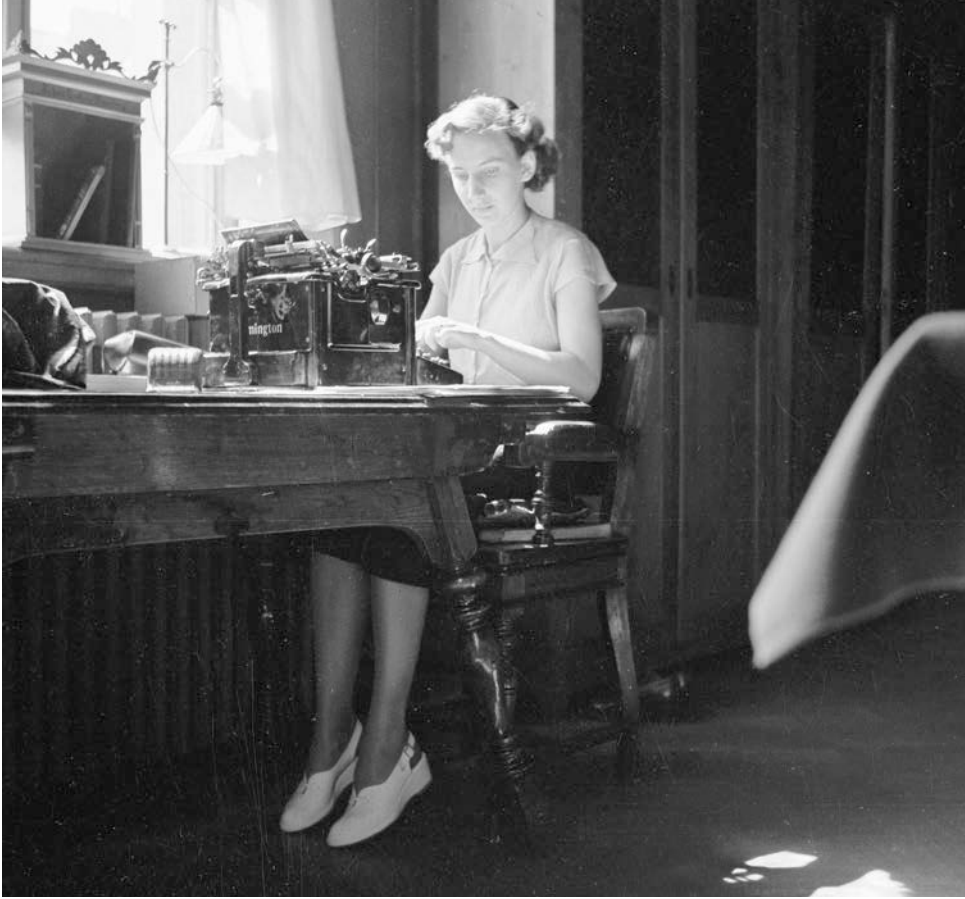
Folkkultursarkivet vid Svenska litteratursällskapet i Finland grundades 1937 och har sedan dess samlat in och bevarat folkminnen. På den här bilden från 1952 arbetar en anställd vid arkivet med folkminnesregistret.

relation till det tema som behandlas. Vid läsningen av materialet fokuserade jag på skribenter som var födda på 1920- och 1930-talet och som därmed kunde kommentera hemmafruns liv på 50-talet.