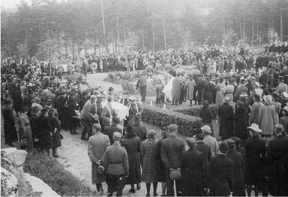
Hjältebegravning i Åbo den 7 september 1941.

som inslag i den stora berättelsen om återuppbyggnaden hänger samman med de förluster kriget inneburit. Att stupa omtalades i finsk press som en fosterländsk gärning, till och med som ett privilegium. Den personliga sorgen skulle behärskas och underordnas den kollektiva sorgen (Holmila 2008:7–17).