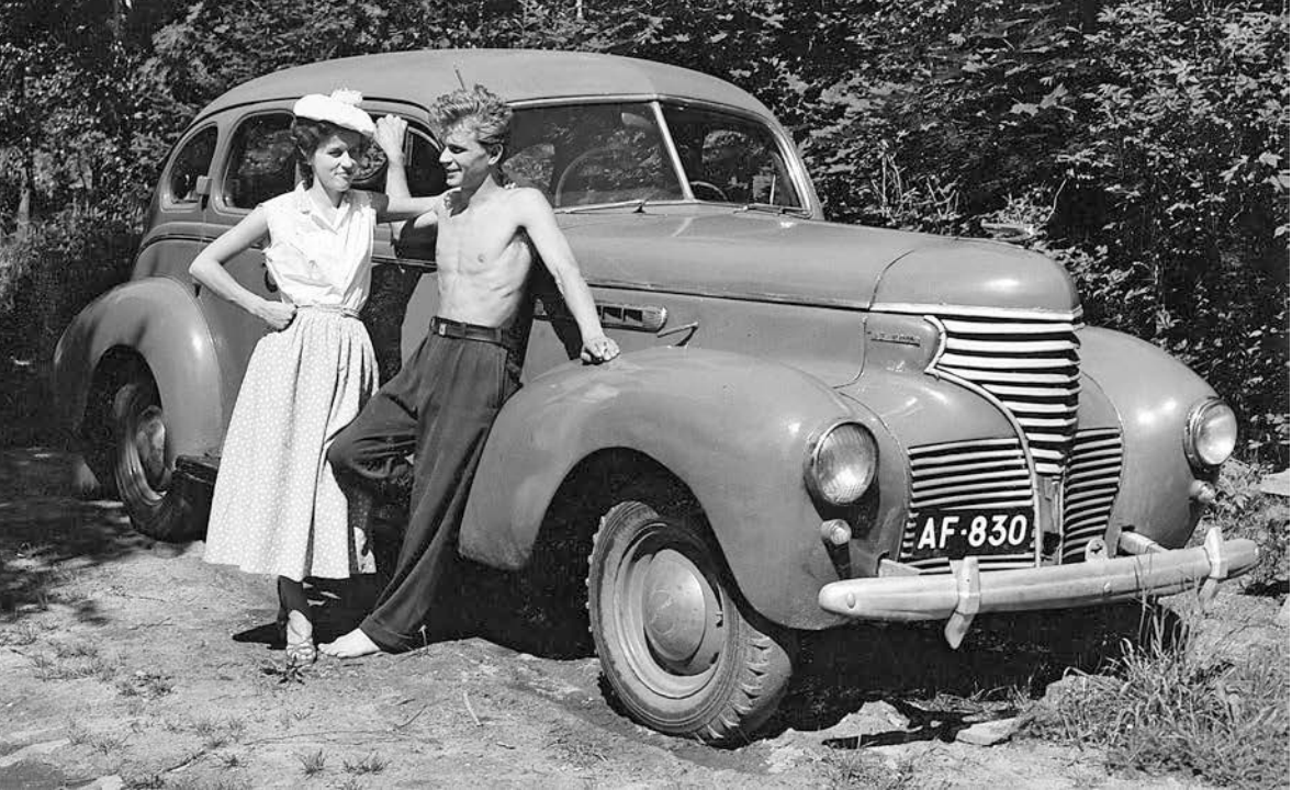
Ungt par på biltur på 1950-talet. Till bilden av decenniet hör också de stora bilarna.

(1978). Här beskrivs en frustrerad hemmafru som upplever sin position som förtryckt, samtidigt som romanen skildrar en resa ut ur hemmet till feministiskt engagemang. Andra bilder av hemmafrun återfinns bland annat i flickboksserien om fröken Sprakfåle av Lisa Eurén-Berner, till exempel Unga fru Sprakfåle (1937). Här framställs hemmafrun i skepnaden av en ung hustru, en yrhätta som har svårt att leva upp till förväntningarna på en hemmafru, nämligen att hon ska sköta hemmet och laga mat. Däremot kan hon segla. Hon framställs som uppnosig, företagsam och hyperkvinnlig (Halldén 1994:122–125). I den populära finska flickboksserien om Tiina, författad av Anni Polva, gestaltas en 50-talsfamilj med en yrkesarbetande pappa och en hemmavarande mamma. I bokserien framhålls betydelsen av gott uppförande och en traditionell genusordning. Tiina representerar en modern typ av ung kvinna som klär sig i jeans. Hon är kvinnlig och hänger sig åt romantiska drömmar men kan också ge sig ut på äventyr. I hemmet är Tiina mors hjälpreda (Vesanto 2010:18–25). Ett färskt exempel på en litterär gestaltning av hemmafrun är Kristina Sandbergs roman Sörja för de sina (2012), som utspelar sig under det svenska folkhemmets framväxt på 1940- och 1950-talen.