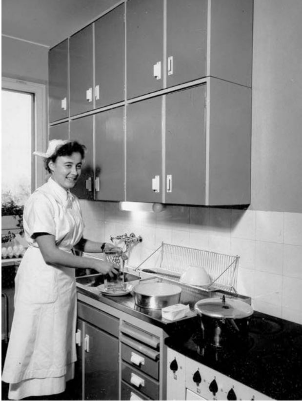
Unga kvinnor kunde få kunskaper i matlagning bland annat på Högvalla seminarium i så kallade modellkök.