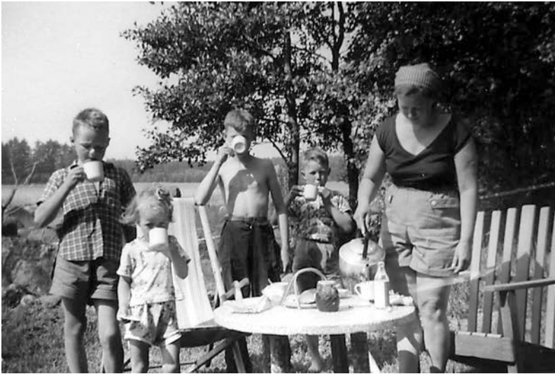
Omsorg och uppfostran uppfattades som moderns uppgift. Här serverar mor kaffe på sommarstugan i Lovisa under tidigt 1950-tal.