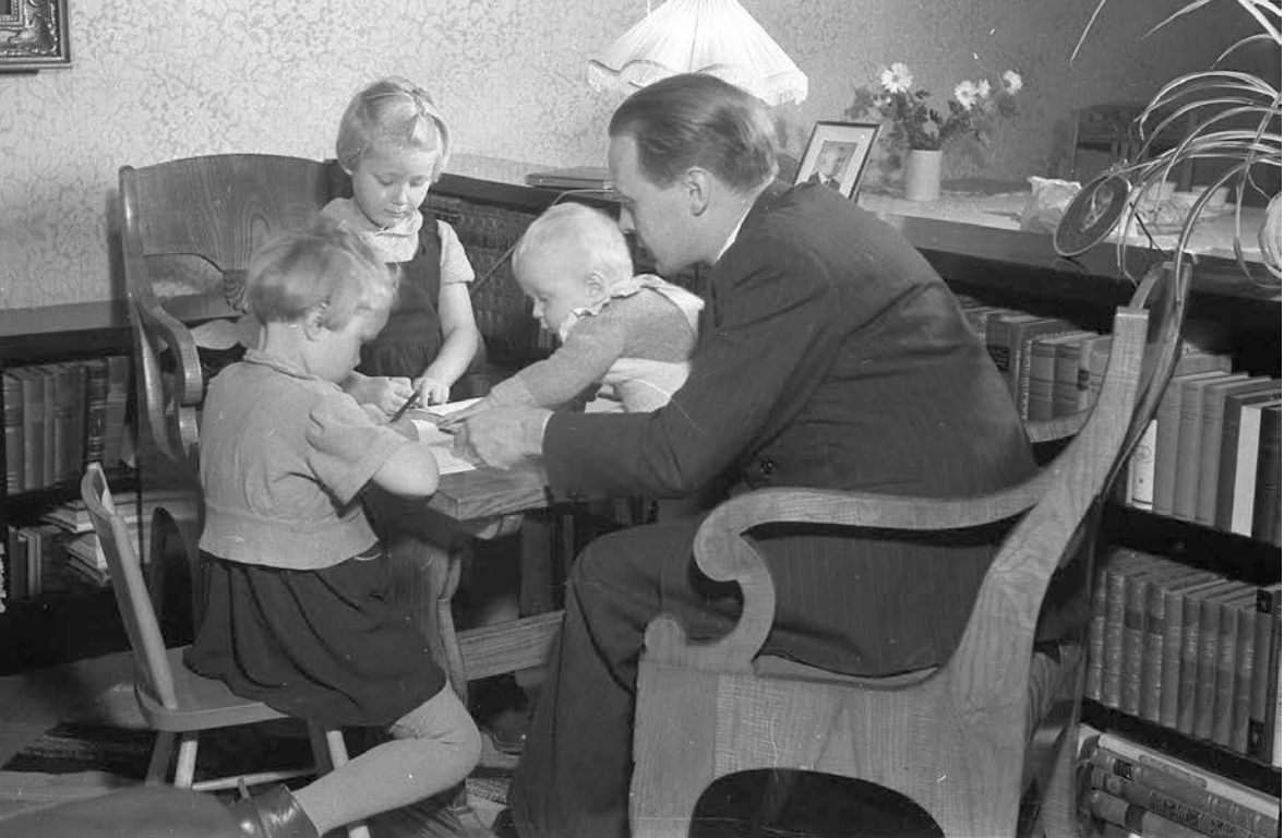
Till fadersrollen under 1950-talet hörde ofta att vara en lekande fritidspappa. Här leker en pappa med sina barn i ett Helsingforshem 1950.