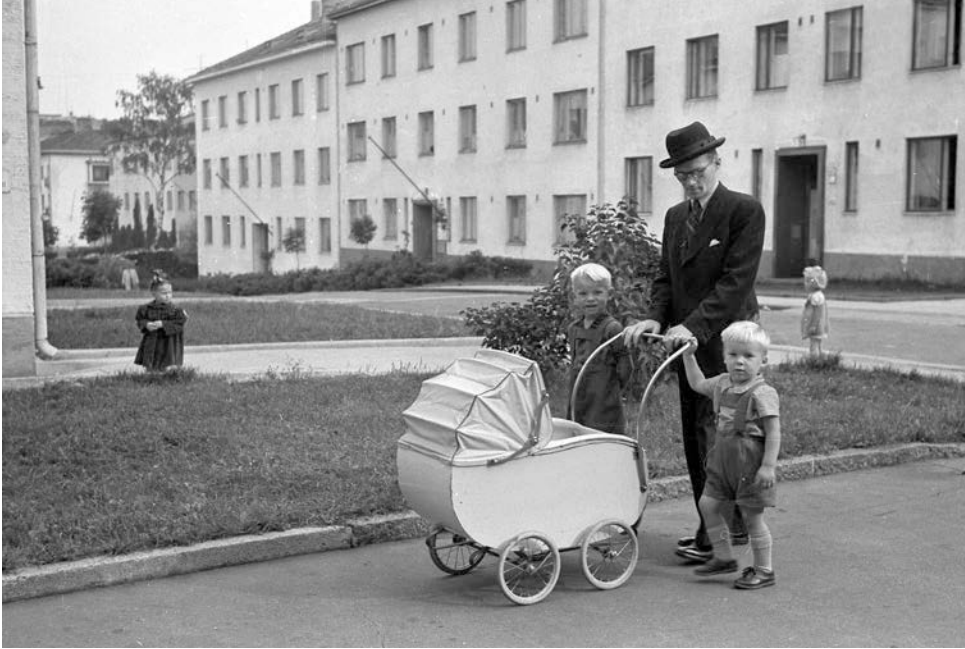
Pappa på promenad med sina söner i Helsingfors 1946. Efter krigen förändrades faderns roll från en auktoritär till en mer vardagsnära pappa.

baserad på ett material insamlat 1991, kommer fram till att kvinnorna som skrev dessa levnadsberättelser främst använde sig av två narrativa strategier eller modeller. Den ena modellen, som hon kallar familjistisk, går ut på att mannen och hustrun tillsammans arbetar för familjens bästa. Den andra är en maternalistisk modell där modern aktivt ställer sig på barnens sida och där mannen uppfattas som ett hot mot familjen (Nätkin 1997:198). De negativa utsagorna i mitt material kan tolkas som delar av sådana maternalistiska berättelser.