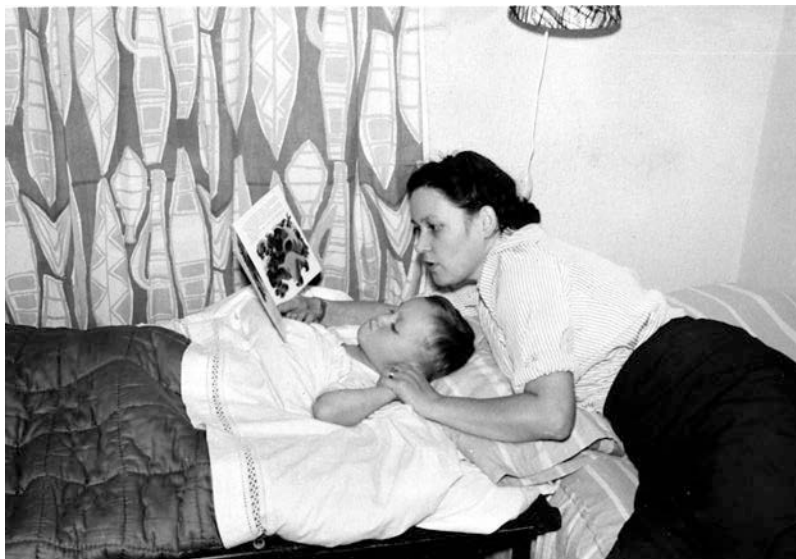
Mor läser godnattsaga. En närvarande mor ansågs göra barnen "immuna för nevroser".