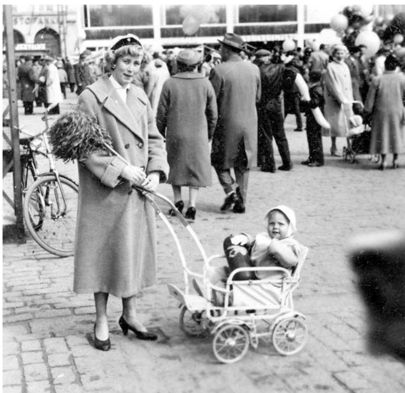
Mor på promenad med sitt barn i Åbo första maj 1957.