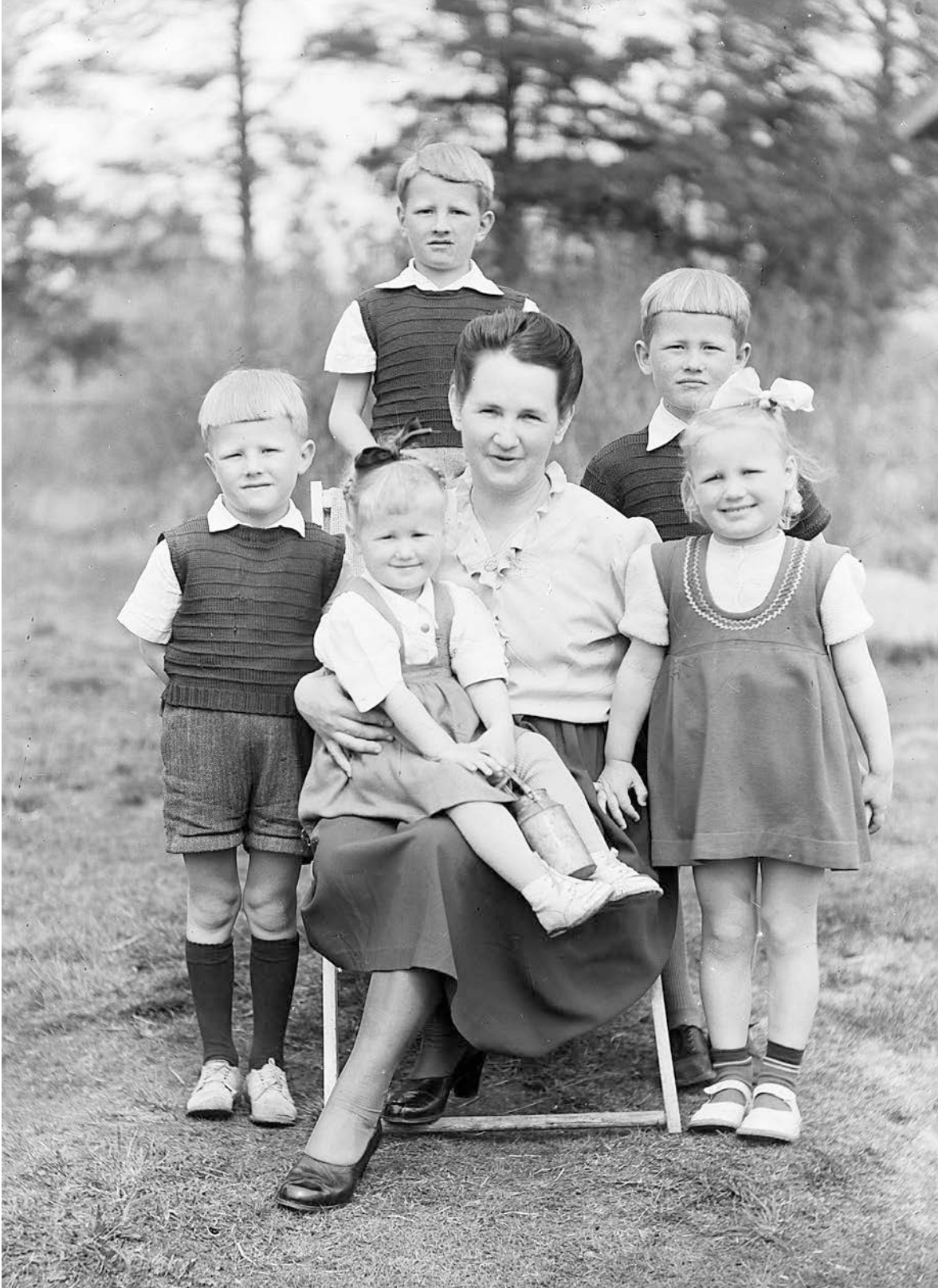
På 1940- och 1950-talet föddes många barn och familjerna var relativt stora. Barnskötsel var en av hemmafruarnas främsta uppgifter. På bilden ses en mor med sina barn i Österbotten.