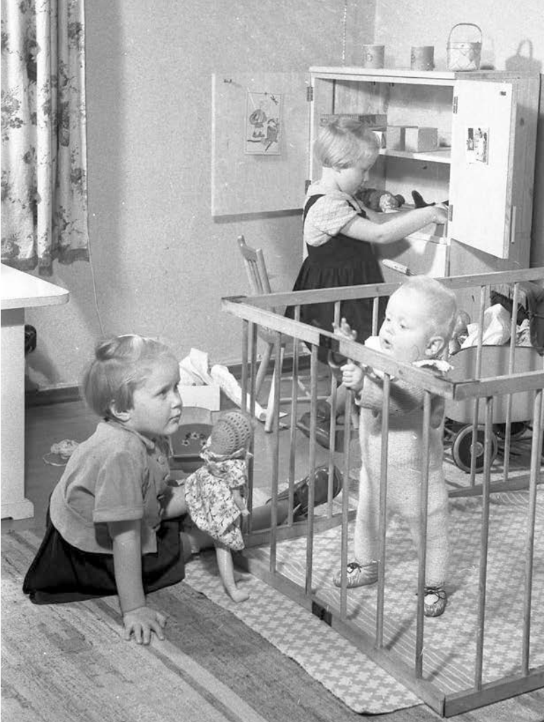
Barnen lekte ofta ensamma i barnkammaren. Barnhagen användes för att husmodern skulle kunna sköta andra sysslor medan barnen lekte.

mycket viktig plats. De var och förblev alltid föremål för min största omsorg och omtanke. Dem ägnade jag alla mina krafter.