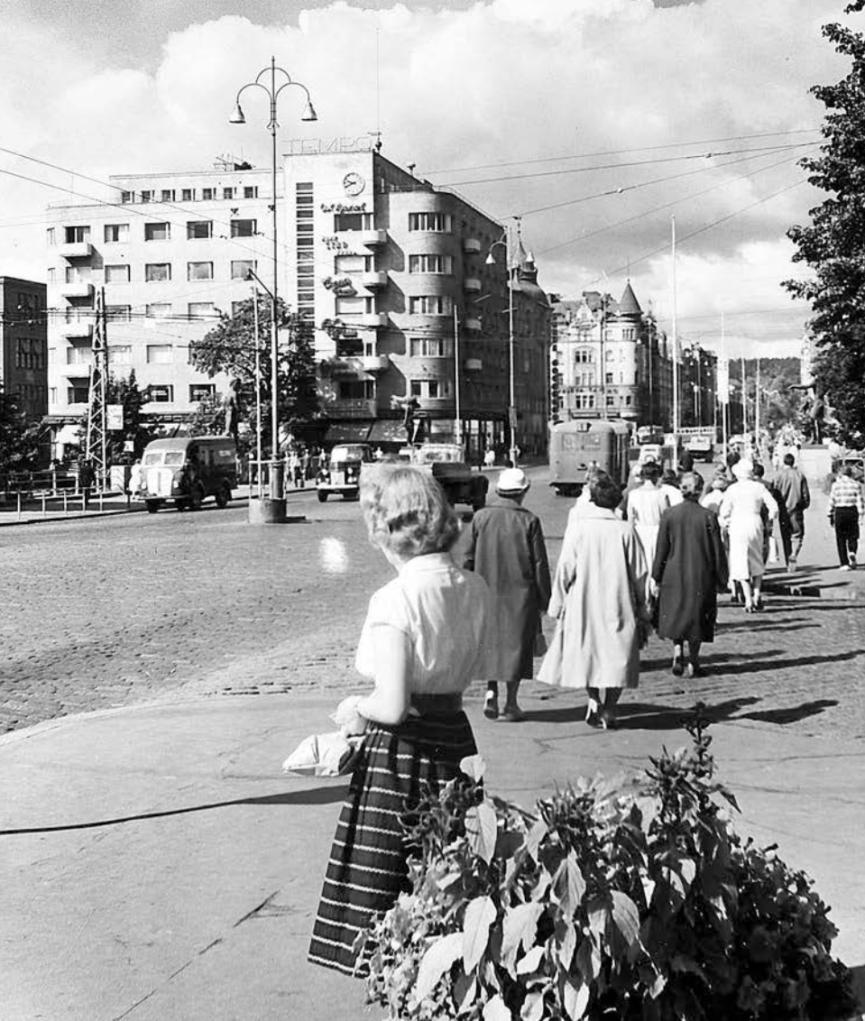
Fotgängare på Hämeensilta och Hämeenkatu i Tammerfors på 1950-talet.

sexualitet med deras bästa i åtanke, för att döttrarna skulle ha ett värde på äktenskapsmarknaden och utomäktenskapliga barn kunna undvikas. I artikelserien "Samtal med min dotter" betecknas fenomenet att samla på dejter som olämpligt för "vår svenska ungdom", eftersom det innebär att "flyga från den ena partnern till den andra" (F 13/1955). Hur ungdomar ska lära känna varandra för att kunna hitta den "rätta" diskuteras inte.