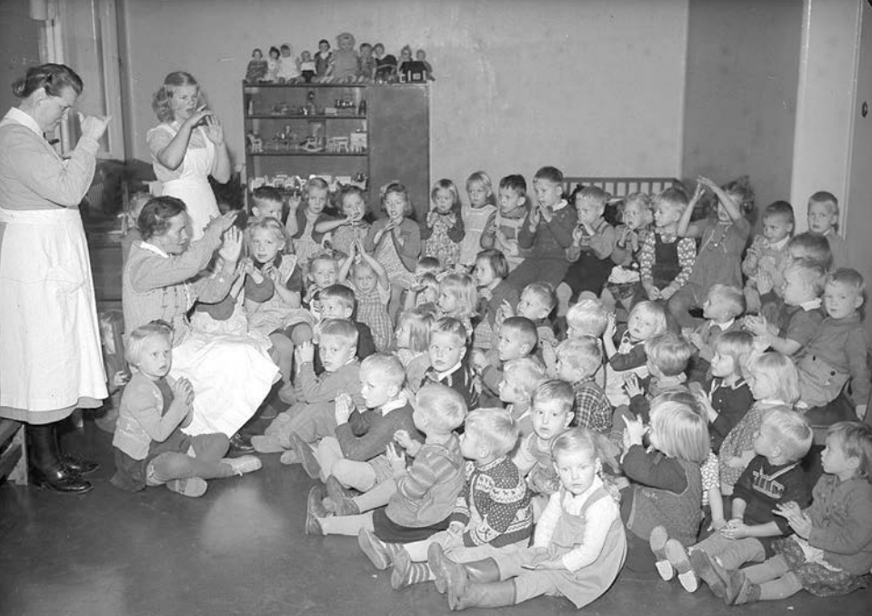
Trots att det rådde brist på heldagsbarnomsorg fanns daghem eller barnträdgårdar även på 50-talet. Frälsningsarmens barnträdgård i Helsingfors 1950.