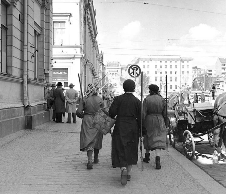
Gatuvy från Åbo 1957.

min analys kommer jag att visa att deras berättelser inte enbart tar sin utgångspunkt i minnen från 1950-talet utan även kommenterar senare tiders diskussion om hemmafruar och om kvinnors och mödrars utmaningar i dagens samhälle.