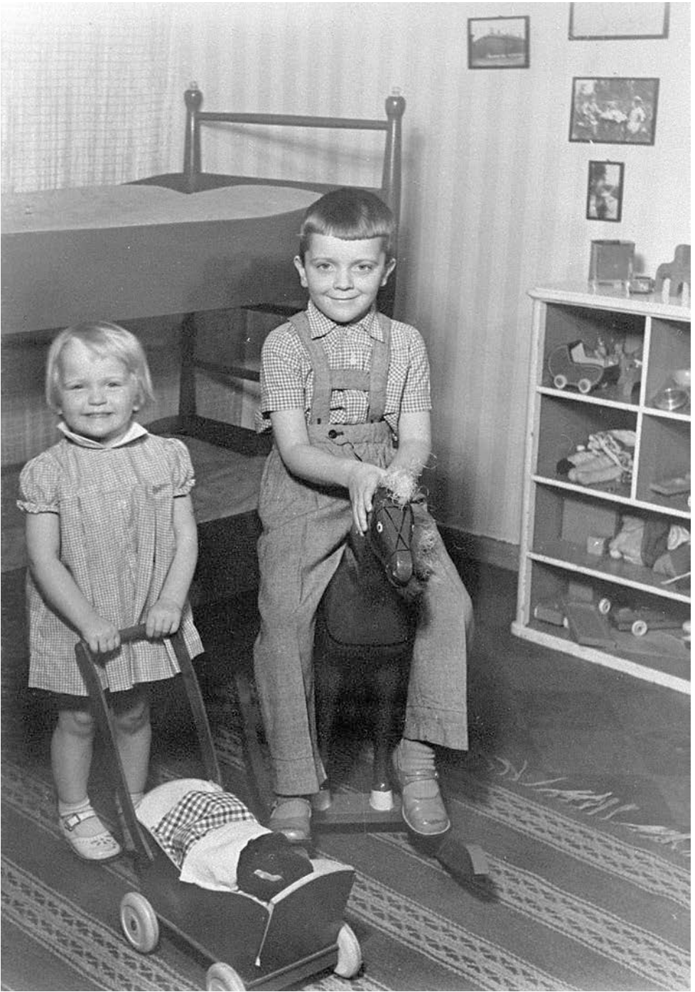
Ett syskonpar leker i barnkammaren i ett Helsingforshem vid mitten av 50-talet.