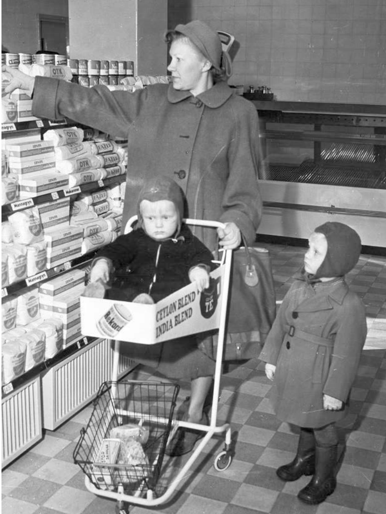
En mor med sina barn handlar i det kooperativa företaget Elantos första självbetjäningbutik i Helsingfors 1950.

med utgångspunkt i skönlitteratur, hur hemmafrun beskrivs som en parasit, en som snyltar på andra i samhället utan att bidra med någon eget (1987:182–185). Detta uttryck förekommer i en av intervjuerna, där Molly berättar om en händelse på 1970-talet: