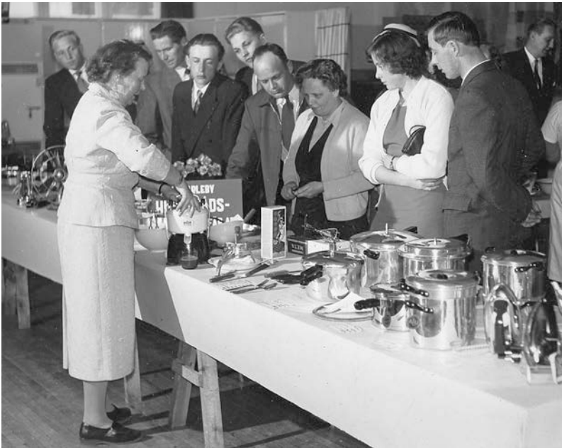
Saftpress demonstreras på bostadsutställningen i Gamlakarleby 1958.