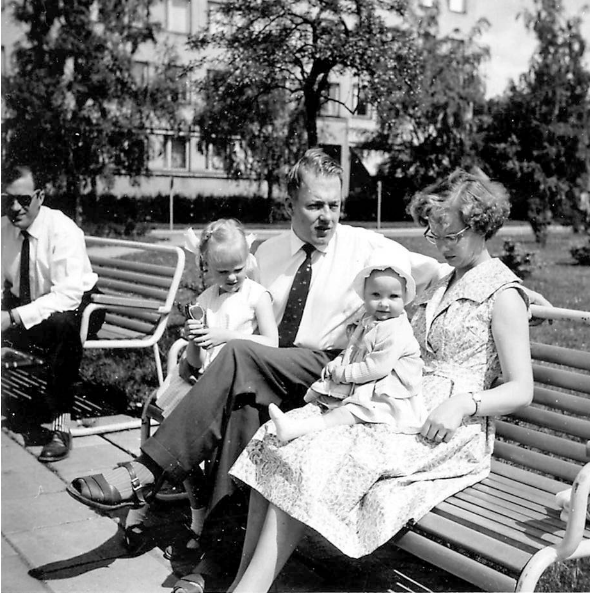
Familjen Marander sommaren 1959. Författaren, som här sitter i sin mors knä, har inte egna minnen från 1950-talet, men hennes föräldrar var unga då och mitt i den fas av livet som de intervjuade hemmafruarna berättar om.

het, dels som ett metaforiskt rum. I kapitel 4 möter vi hemmafrun i det mest centrala rummet för hennes verksamhet, köket. Här behandlas professionaliseringen av husmodern, matlagning, städning samt makens andel i hemmasysslor. I kapitel 5, "Matsalen och vardagsrummet", presenteras andra sidor av hemmafruns uppgifter, såsom skapandet av en trevlig atmosfär i hemmet och rollen som värdinna eller representationshustru, men också relationerna till maken, familjens ekonomis-