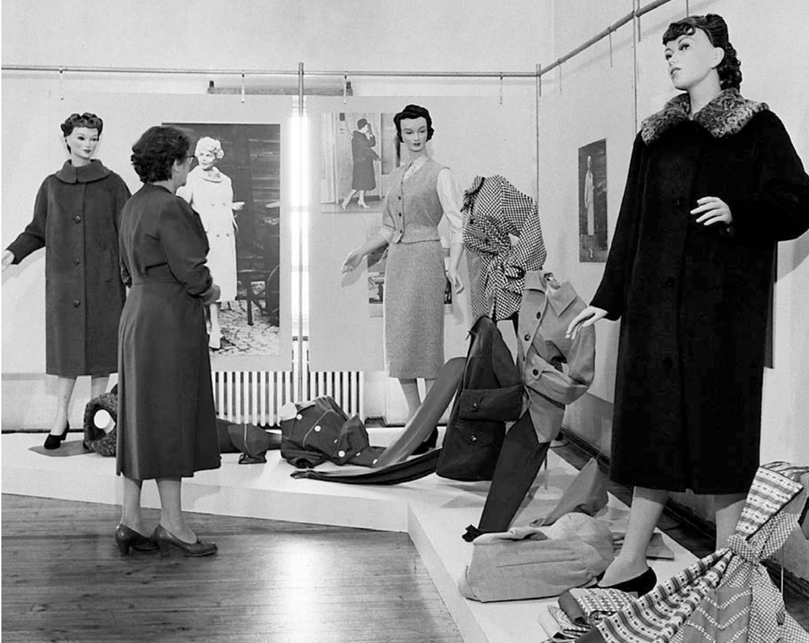
En kvinna bekantar sig med det senaste modet på en utställning i Mässhallen i Helsingfors 1958.

Modereportagen gestaltar en syn på konsumtion någonstans mellan det hedonistiska och det rationella. Den rationella konsumtionen karaktäriseras av frånvaro av nöje, flärd och begär medan den hedonistiska konsumtionen är ett tidsfördriv präglad av impulsivitet och ytlighet (Husz 2001:73–80). Dels skulle kvinnan konsumera för att behålla sitt chika och attraktiva utseende, dels skulle hon inte slösa (för) mycket pengar på kläder. Den senare aspekten kommer fram i artiklar med råd om hur gamla kläder kan bli som nya genom vissa omändringar. Spar-samhet ses som en dygd och en egenskap som gjorde kvinnan attraktiv på äktenskapsmarknaden. I en uppsats av Jenny Hansson presenteras olika typer av kvinnliga konsumenter i Sverige från 1930-talet och framåt. Här beskrivs den skötsamma konsumenten som i kristider skulle hushålla med resurserna, men också den icke-rationella, slösaktiga konsumenten som köpte skönhetsprodukter, lockade håret och rökte. Hansson tolkar denna ”nya kvinna” dels som emancipatorisk, som en kvinna som försökte frigöra sig från en traditionell kvinnoroll, dels som