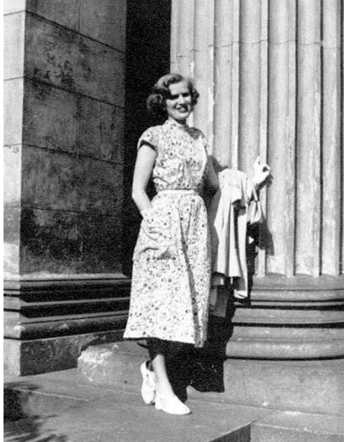
En nyförlovad kvinna på Ständerhusets trappa i Helsingfors 1954.

föreställning. I veckotidningsmaterialet diskuteras vägar till ett lyckligt äktenskap. Den hemmavarande hustrun uppmanas att inte framföra en klagovisa när mannen kommer hem, utan i stället välkomna honom med tofflor och en varm måltid. Familjeförsörjaren i sin tur rekommenderas att uttrycka intresse för sin hustru, till exempel med vänliga ord såsom "Stackars lilla du, som får gå här ensam hela dagen" (HV 11/1951). Ansvaret för lyckan i äktenskapet läggs på båda parterna, men antar olika former för dem. Kvinnan förväntades vara omtänksam medan mannen förväntades vara hederlig. Samtidigt får de svenska männen sig en tillrättavisning för bristande omtänksamhet och ridderlighet. Mannen betecknas som det svagare könet, eftersom gossebarn har högre dödlighet än flickor och kvinnor lever längre än män. Kontentan av detta är att kvinnorna, hemmafruarna, uppmanas att pyssla om sina män eftersom dessa tyngs av bördan att vara familjeförsörjare: "Det är behagligare för oss [män] att bli ompysslade av någon, för vilken våra bekymmer och arbetsresultat är viktigare än hennes egna" (F 8/1959). Kvinnorna uppmanas att ta ansvar för släktets fortplantning, eftersom män och kvinnor är så olika på erotikens område. De ska uppträda stolt i stället för att nedslagna sitta ensamma när mannen blir "gubbsjuk" och söker sig till yngre kvinnor (HV 11/1951). En förständig hustru förväntas förlåta sin otrogne man (F 2/1951).