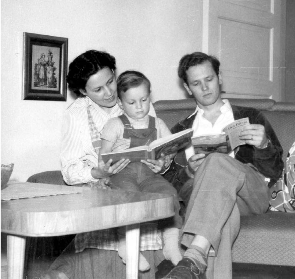
En vanlig dag i vardagsrummet 1957. Mor läser för barnet medan pappa är fördjupad i Det Bästa .

världspolitiskt dagsläge, vars angelägenheter i vår tid trängt sig ända in på husmödrarnas områden” (1/1959). Av artiklarna framgår klart att husmödrar, både yrkesarbetande och hemmafruar, hade ansvar för matlagning, städning och barnuppfostran. Samtidigt skulle de fungera som värdinna, hushålla med en begränsad kassa, ta hand om sitt yttre samt finnas till för sina barn och se till att de betedde sig på önskvärt sätt. Hemmafruns vardag bestod således av olika uppgifter som innebar att hon måste kombinera olika roller som krävde olika typer av kunskap och färdigheter.