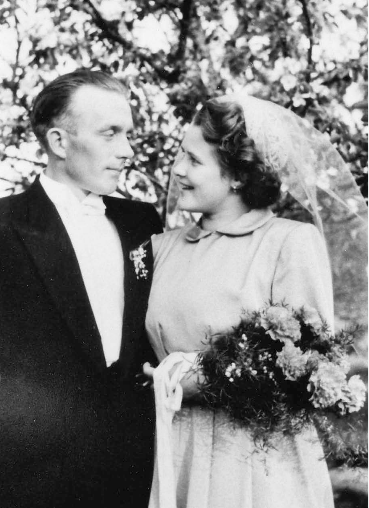
Under 1950-talet ingicks många äktenskap. Bröllopen kunde vara stora kyrkbröllop men också små bröllop som firades i hemmen inom den närmaste familjekretsen. Den här bröllopsbilden är från 1953.