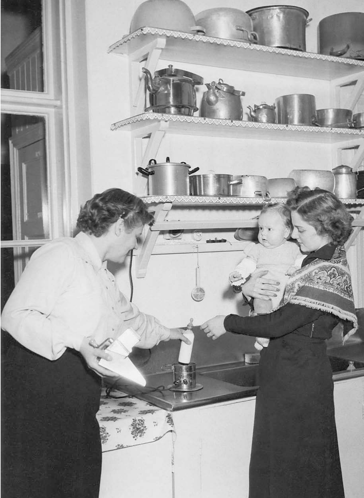
Barnskötsel och matlagning var hemmafruarnas främsta uppgifter. På den här bilden från början av 1950-talet värms mjölk upp för en baby.