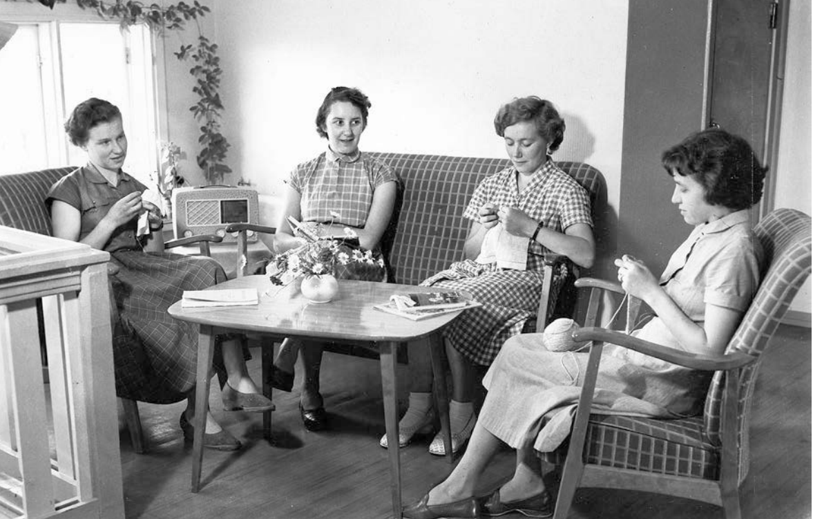
Syjunta vid Högvalla seminarium i huslig ekonomi på 1950-talet.

morna: "Det tror jag inte att man gjorde på den tiden. Det har jag inget minne av. Nog kunde man kanske säga någonting men inte på ett djupare sätt. Mera så här ytligt." Däremot menar hon att sådana saker kunde ventileras med en väninna på tumanhand. Att man inte lyfte fram de problem som fanns i familjen eller med barnen kan hänga ihop med att problemfria, oklanderligt uppfostrade barn sågs som ett tecken på att man lyckats som hemmafru.