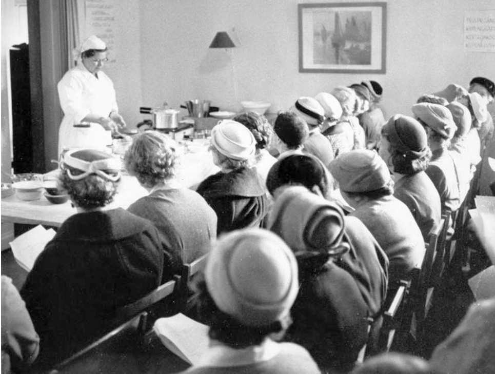
Som ett led i upplysningsarbetet som riktade sig till husmödrar ordnades kurser i matlagning. Här demonstreras vardagsrätter under kursen "Vad skall jag bjuda på i dag?" 1958.

och att kvinnan borde ha friheten att välja om hon ville stanna hemma (Liljeberg-Elgert 1999:104–110).