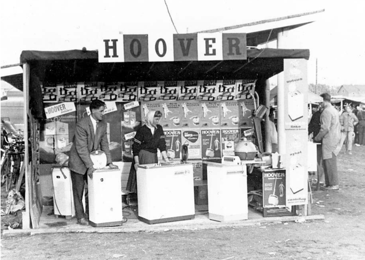
Hoover-tvättmaskiner demonstreras på marknaden i Ekenäs 1959.