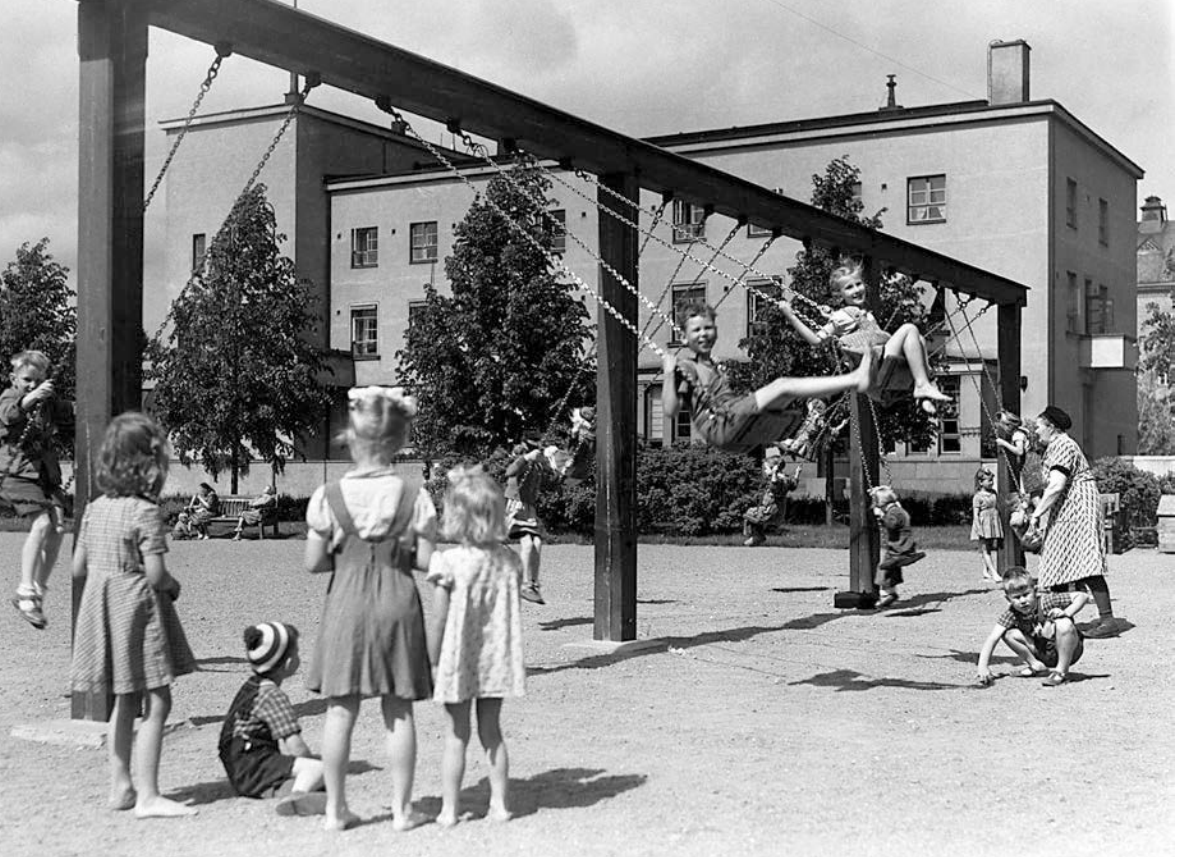
Befolkningsfrågan diskuterades alltsedan 1930-talet och familjer med många barn såg som ett mål. På bilden ses barn i Författarparken i Helsingfors på 1950-talet.

att vara mamma. Samtidigt måste man komma ihåg att även kvinnorna i mitt material påverkades av den stora berättelsen om samhällsmodern och det goda moderskapet.